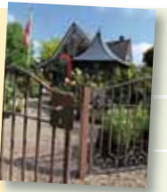
Borken, Gartentage (Garten Picker)