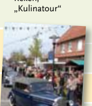
Heiden, Heidener Herbst