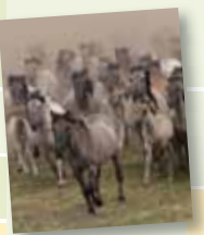
Dülmen, Wildpferdefang