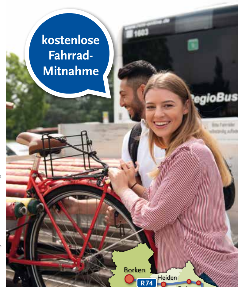
zeitfreibeuter design - www.zeitfreibeuter.de · Titelbild: ©ZVM Zweckverband Mobilität Münsterland Fachbereich Bus