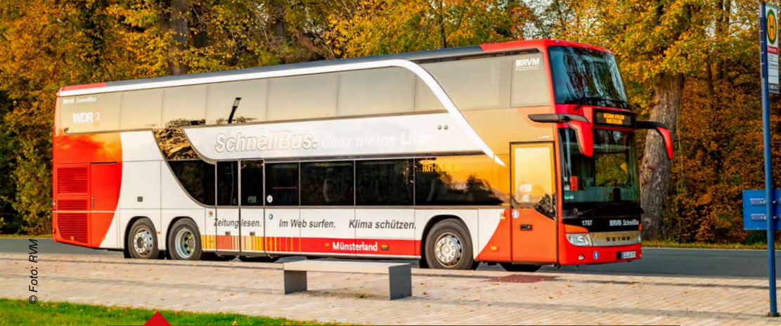
Die RVM betreibt im Münsterland sieben SchnellBus-Linien.

Schülerverkehr – Schüler stellen die Hauptkundengruppe im Regionalverkehr dar. Viele Linien orientieren sich primär an den Schulen und Schulzeiten, sind aber für jedermann nutzbar, da nach → PBefG § 42 genehmigt. Für die Ausgabe rabattierter Zeitkarten im Ausbildungsverkehr erhalten die Verkehrsunternehmen Ausgleichszahlungen. Schülerverkehre werden teilweise auch als → freigestellte Verkehre durchgeführt. Sie sind dann von den Regeln des → PBefG ausgenommen.