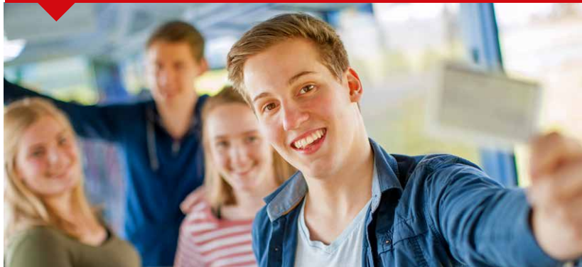
Rund 68.000 Schüler nutzen im Mittel an einem Schultag die Busse der RVM im öffentlichen Linienverkehr.

SPNV – Schienenpersonennahverkehr, bildet zusammen mit dem → ÖSPV den → ÖPNV.