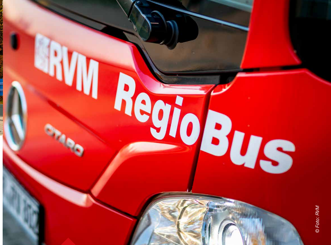
RegioBusse verkehren in der Regel stündlich und verbinden kleinere Kommunen mit Mittelzentren und Mittelzentren miteinander.

SPNV – Schienenpersonennahverkehr, bildet zusammen mit dem → ÖSPV den → ÖPNV.